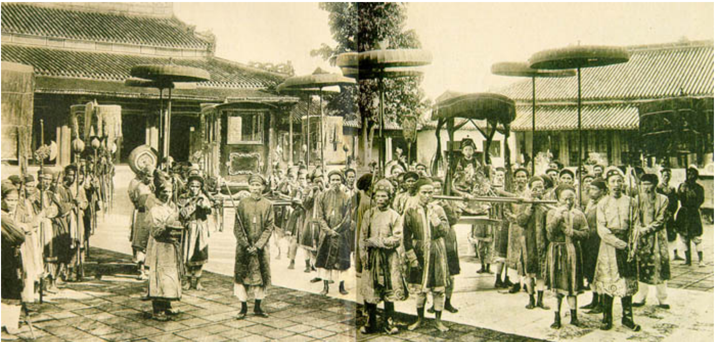
Dignitari di corte e ufficiali dell'esercito vietnamita