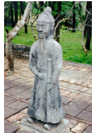
Guardiani delle tombe degli imperatori vietnamiti, armati rispettivamente con Kiem, Dao e Daidao