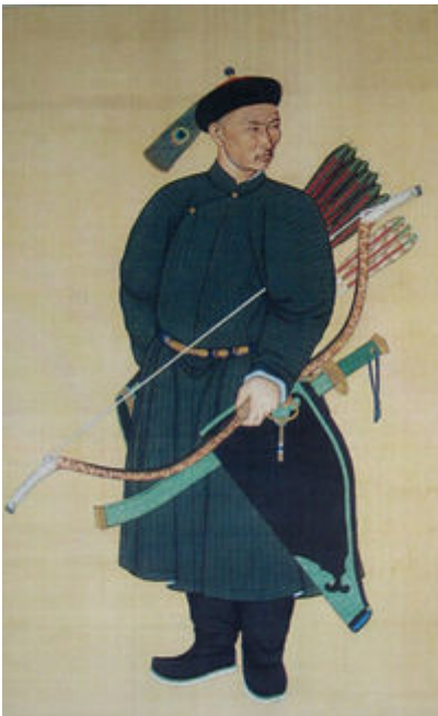
Una guardia del corpo Manchu dell'imperatore Qialong (1760) con al fianco un dao

Nel XIII secolo, i mongoli invasero gran parte della Cina e attaccarono l'odierno Vietnam, nel processo di conquista del più grande impero territoriale della storia. La dinastia Yuan dei mongoli influenzò la Cina e le altre nazioni considerevolmente, specialmente nelle strumentazioni e tattiche di guerra. Una delle armi preferite dalla cavalleria mongola era la sciabola: questa semplice lama curva a un solo taglio era usata dai turchi e dalle tribù dell'Asia centrale sin dalla fine dell'VIII secolo. La sua efficacia sui campi di battaglia e la sua massiccia diffusione attraverso l'intero impero mongolo ebbero come effetto una forte influenza sulle armi dell'Asia e persino dell'Europa.