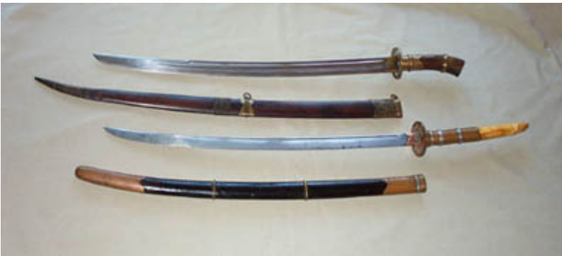
Spade vietnamite del XIX secolo

anche alla katana giapponese, è interessante ricordare che dal 15°-16° secolo i Giapponesi erano presenti in Thailandia e sulle coste vietnamite. In Thailandia servivano come mercenari, nel doppio ruolo di soldati e pirati. Nelle spade vietnamite del 19° secolo riportate nelle due figure successive è chiaro l'influsso giapponese soprattutto nella guardia che ricorda la "tsuba" della katana.